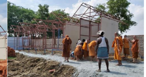
รายงานการสร้างกำแพงรอบวัดฯ - สร้างกุฏิสงฆ์กรรมฐาน - ถมที่ดินสร้าง ศาลาเอนกประสงค์ทรงไทย