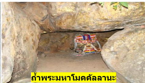
ถ้ำพระมหาโมคคัลลานะ