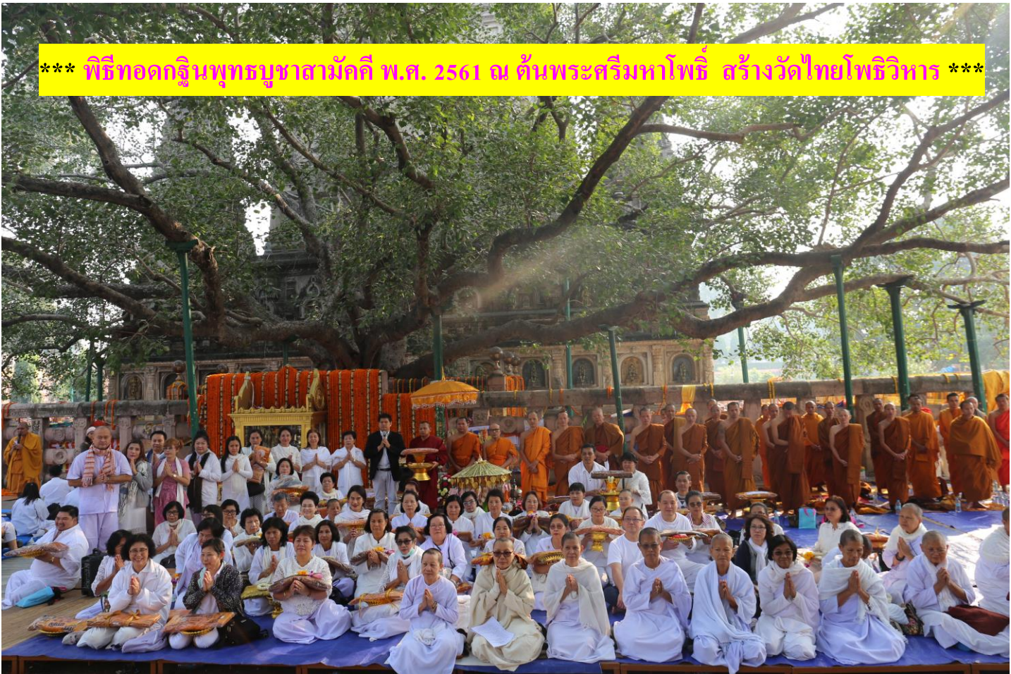
*** พิธีทอดกฐินพุทธบูชาสามัคคี พ.ศ. 2561 ณ ต้นพระศรีมหาโพธิ์ สร้างวัดไทยโพธิวิหาร ***

11.30 น. - เดินทางสู่แดนพุทธภูมิโดยรถโค้ชปรับอากาศ นำท่านสู่พุทธคยา ตำบลเป็นที่ตรัสรู้ของพระสัมมาสัมพุทธเจ้า - บริการอาหารกลางวัน ณ ศูนย์ปฏิบัติธรรมนานาชาติ+เช็คอินเข้าที่พัก+พักผ่อนอริยาบถตามอัธยาศัย