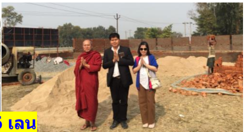
สถานที่สร้างวัด ดัดถนนใหญ่ 6 เลน

15.30 น.- พิธีแห่ผ้ากฐินพุทธบูชาสามัคคี จากที่ดินสร้างวัดไทยโพธิวิหารไปรอบต้นพระศรีมหาโพธิ์ คณะสวดมนต์ตลอดทาง