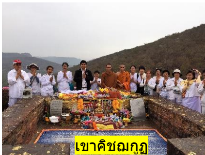
เขาคิชฌกูฏ

09.00 น.- นำคณะเดินธุดงค์ขึ้นสู่ (1) เขาคิชฌกูฏ+นมัสการพระคันธกุฎีที่ประทับของพระพุทธเจ้า+ถวายพระอานนท์พุทธอุปัฏฐาก +ถ้ำสุกรขาตา ที่พระสารีบุตรบรรลुพระอรหันต์+ถ้ำพระมหาโมคคัลลานะ+หน้าผาเชิงเขาคิชฌกูฏ สถานที่พระเทวทัตต์ กลิ้งหินใส่พระพุทธเจ้าหมายปลงพระชนม์ ทำโลหิตุปปบาท+ (2) ชิวกัมพวัน วัดและโรงพยาบาลหมอชีวโกมารภักจ์