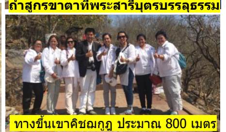
ทางขึ้นเขาคิชฌกูฏ ประมาณ 800 เมตร