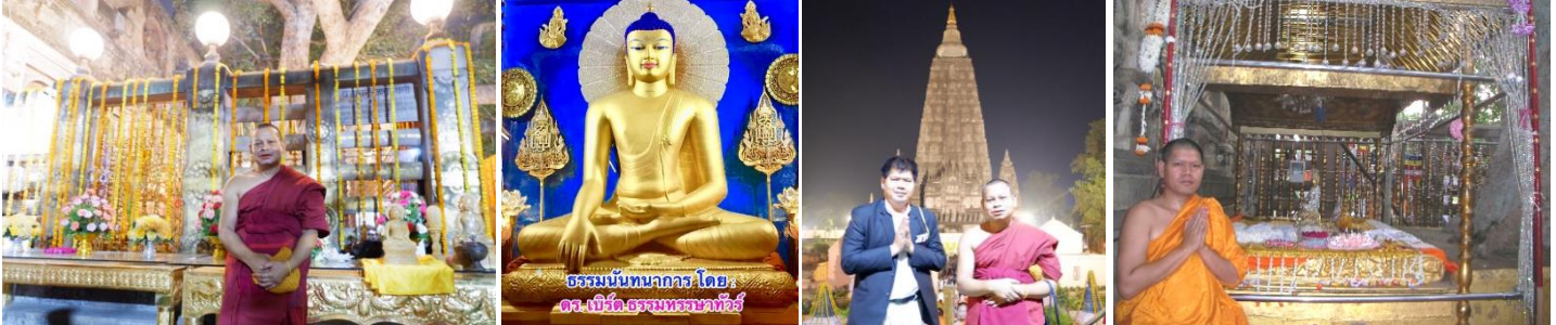
ต้นพระศรีมหาโพธิ์ : สถานที่ตรัสรู้ พระพุทธเมตตา พระมหาเจดีย์พุทธคยา พระแทนวัชรอาสาณ์ โพธิบัลลังก์

14.00 น.-เดินทางสู่ “โพธิมณฑล” +สวดมนต์เจริญสมาธิภาวนา ณ (1) ต้นพระศรีมหาโพธิ์ สถานที่ตรัสรู้ของพระพุทธเจ้า