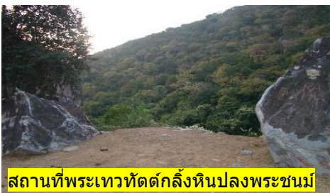
สถานที่พระเทวทัตต์กลิ้งหินปลงพระชนม์