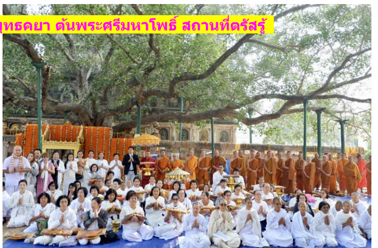
พระมหาเจดีย์พุทธคยา ดันพระศรีมหาโพธิ์ สถานที่ตรัสรู้

ทอดกลิ่น ณ วัดไทยโพธิวิหาร - พิธียกเสาเอก ศาลาอเนกประสงค์ทรงไทย 2 - 5 พ.ย. 62 : FD บินตรงไป-กลับ พุทธคยา (3 คืน/4 วัน) : 19,900.- บาท