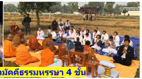
พิธีวางศิลาฤกษ์ : อาคารบุญสามัคคีธรรมหรรมหา 4 ชั้น

จากวันทอดกฐิน 18 พ.ย. 2561 – วันทอดกฐิน 3 พ.ย. 2562 เพื่อสร้างวัดไทยโพธิวิหาร