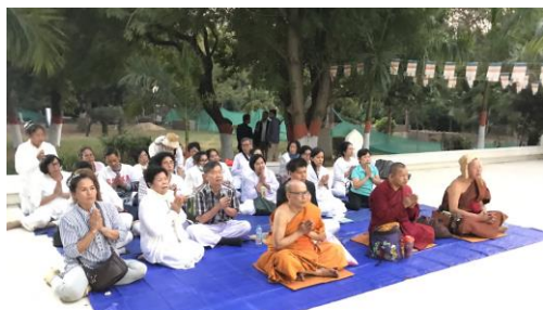
วัดเวฬุวัน แห่งแรกของโลก

15.30 น.- (4) “มาฆบูชารำลึก” ย้อนรอยอดีตครั้งพุทธกาล ณ วัดเวฬุวัน วัดแห่งแรกในโลกที่พระเจ้าพิมพิสารได้สร้างถวาย ซึ่งพระอรียสงฆ์สาวก 1,250 รูป ล้วนเป็นเอหิภิกขุอุปสัมปทามาประชุมกันโดยมิได้นัดหมาย พระพุทธเจ้าแสดงโอวาทปาฏิโมกข์ ทำให้เกิดวัน “มาฆบูชา” ขึ้นในโลก+(5) ชมตโปธาราม ที่อาบน้ำแร่ร้อนแบ่งตามชั้นวรรณะ 4