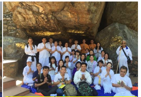
ถ้ำสุกรขาตาที่พระสารีบุตรบรรลุธรรม