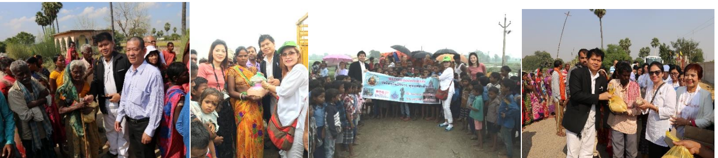
หมายเหตุ : ของแจกทานประกอบด้วย (1) ข้าวสาร 1 ถุง (2) น้ำมันพืชมัดตลับ (3) มันทิปะหลัง (4) อื่นๆ ที่เห็นสมควร/เงินรูป

11.00 น.- เดินทางไปเยี่ยมชม “วัดพุทธนานาชาติ” เช่น วัดญี่ปุ่น ไหว้หลวงพ่อดโตโคบุตร+วัดกุฎฐาน วิหารปูนปั้นพุทธประวัติ 11.30 น.- บริการอาหารกลางวัน ณ ศูนย์ปฏิบัติธรรม+จากนั้นพักผ่อนอิริยาบถ+ออกเดินทาง ไปบริเวณสร้างวัดไทยโพธิวิหาร 13.30 น. - พิธีแจกทานแก่คนท้องถิ่นผู้มีรายได้น้อยฐานะยากจน ณ หมู่บ้านสักวาระ (ผู้ประสงค์จะเป็นเจ้าภาพชุดละ 300 บาท)